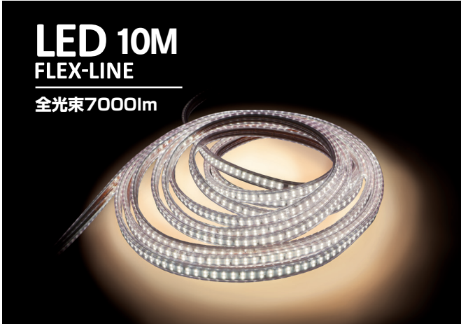
LED 10M FLEX-LINE 全光束7000lm

工事現場・作業現場・店舗装飾・イベント空間演出など多彩なシーンで活躍しています! サイズは10mと20mの2タイプがあり最大50mの連結が可能です。