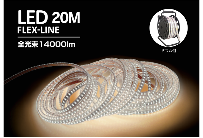
LED 20M FLEX-LINE 全光束14000lm